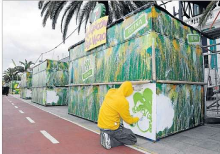
Cerveza Reina. Los grofiteros Sabotaje al Montaje. Soduas y Suglas decoran los ventorrillos del carnaval.

Por la noche, la fiesta continuará en la traseira de Santa Catalina, y Guaguas cuenta con servicios exclusivos para los mogollones, con una terminal especial en la calle Simón Bolívar.