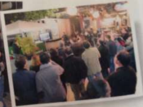
Las imágenes corresponden al evento de presentación del nuevo vídeo de La Trova.