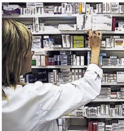
Imagen de una farmacia. [1]/ [2]

El ministro de Sanidad fijó el copago de estos medicamentos, (un total de 43 fármacos en 157 prestaciones), en el abono de un 10% del precio de la caja y con un máximo de 4,2 euros por envase. La propuesta, explican, está contemplada para favorecer la sostenibilidad del sistema público de salud. Desde su discusión en el Consejo Interterritorial de Salud de